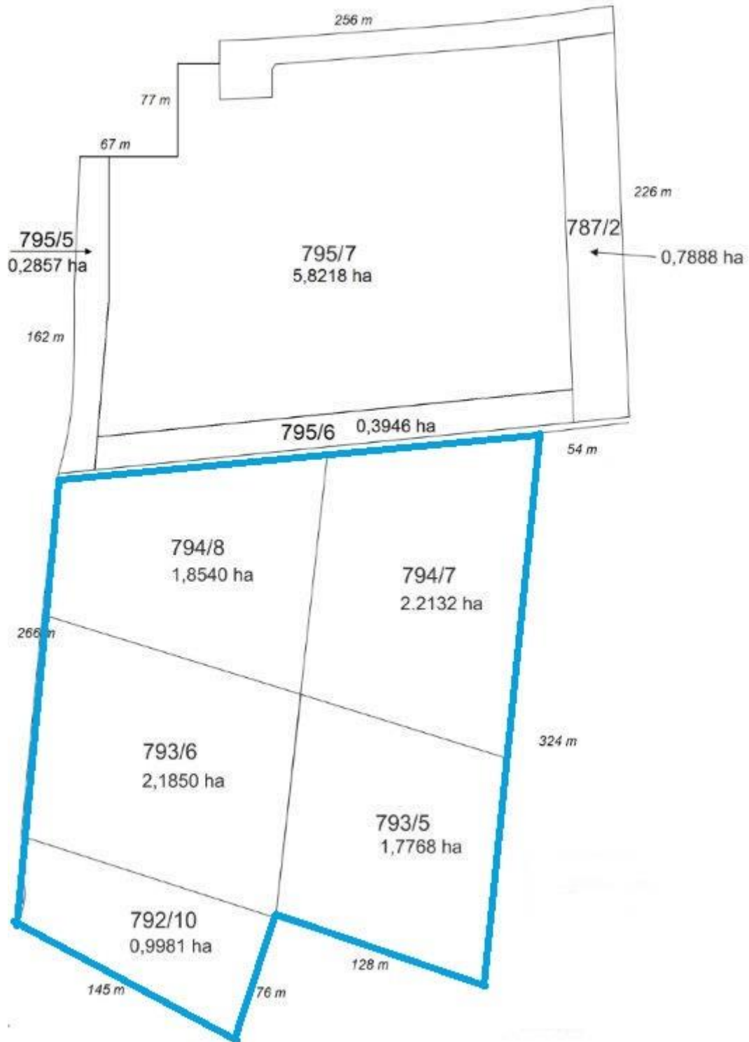
Rys. 3. Podział działek i długości granic Fig. 3. Estate division and the lengths of the borders