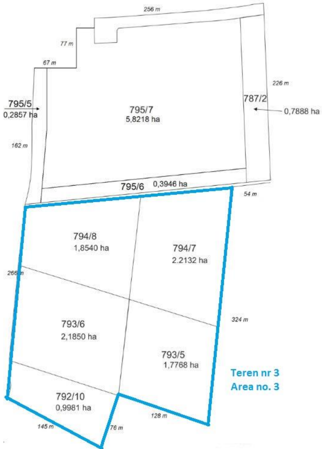
Rys. 3. Podział działek i długości granic Fig. 3. Estate division and the lengths of the borders